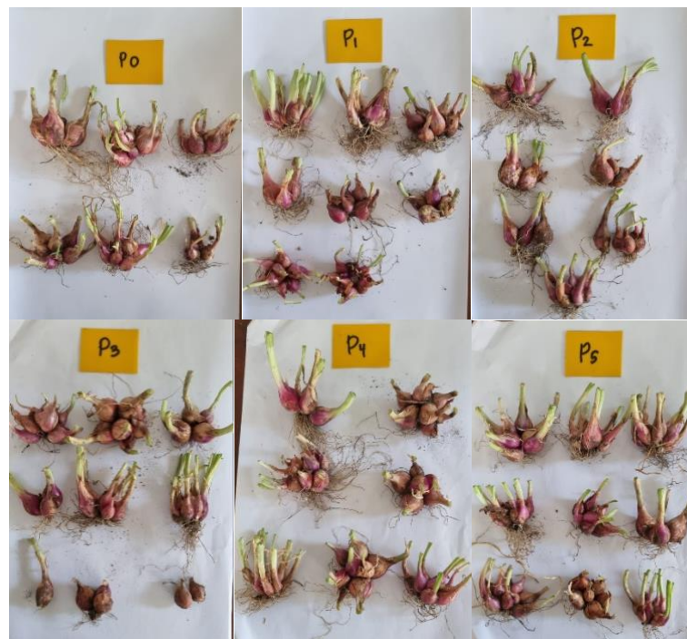
Gambar 3. Umbi Bawang Merah 60 (MST)

Konsentrasi Pb tidak mempengaruhi pertumbuhan dan hasil bawang merah seperti tinggi tanaman, jumlah daun, jumlah umbi dan bobot umbi. Hal ini disebabkan konsentrasi Pb 25-150 ppm yang mencemari media tanam tidak menghambat metabolisme tumbuhan. Konsentrasi logam berat Pb mempengaruhi jumlah mikronukleus pada tanaman. Semakin banyak jumlah mikronukleus maka jumlah kromosom yang mengalami kerusakan semakin banyak ( Marhamah, 2018 ). Tanaman yang terpapar logam berat pada konsentrasi tinggi menyebabkan kerusakan aktivitas metabolisme yang menyebabkan kematian tanaman. Paparan kadar logam berlebih pada tanaman menghambat enzim yang aktif secara fisiologis, menonaktifkan fotosistem dan merusak metabolisme mineral ( Mendrofa & Nurkhamim, 2021 ).