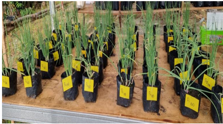
Gambar 1. Morfologi Pertumbuhan Bawang Merah 1 MST.

Pertumbuhan tanaman bawang merah tidak menunjukkan adanya pengaruh pemberian Pb pada umur 1 minggu setelah tanam (MST) (Gambar 1). Bawang merah memiliki warna daun hijau yang sama antar perlakuan.